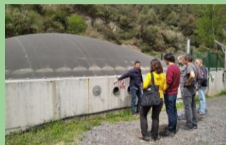
Training van landbouwers over geanalyseerde BBT's