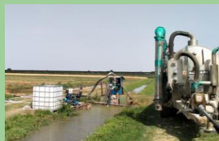
Fertigatie met gemicrofilterd digestaat in ondergrondse druppelleiding